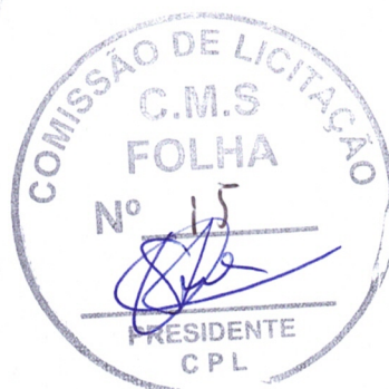
Edimar Fabiano de Almeida Setor Contábil da Câmara Municipal